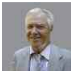
Директор Інституту психології ім. Г.С. Костюка Національної АПН України, доктор психологічних наук, професор Сергій МАКСИМЕНКО

За даними «Центру цифрових технологій майбутнього», 25% дорослих стурбовані тим, що їхні діти проводять в інтернеті забагато часу, 53% вважають кіберзлочинність реальною загрозою, а 63% висловлюють схвильованість через спілкування їхніх дітей у віртуальних співтовариствах, що лякають сучасних батьків так само, як попередні покоління бачили загрозу в негативному впливі «вулиці» на дітей. При цьому 46% користувачів всесвітньої мережі, які належать до молодіжної аудиторії, особисто зустрічалися зі своїми віртуальними знайомими. Для когось інтернет може бути єдиним джерелом спілкування, але слід враховувати те, що віртуальна реальність ніколи не замінить гармонійних взаємин і повноцінного спілкування між людьми.