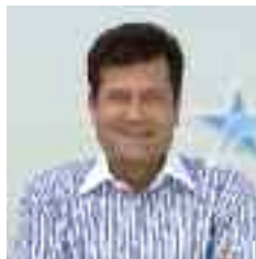
президент «Київстар» Ігор ЛИТОВЧЕНКО

Наше завдання як дорослих і батьків - навчити дітей використовувати інтернет правильно. Так само, як ми вчимо дітей безпеки в реальному житті - на вулиці та дорозі, нам необхідно навчити їх безпечній поведінці у віртуальному житті - в інтернеті. Цей посібник покликаний допомогти батькам впоратися з цим завданням. У ньому просто та зрозуміло викладені основні правила та рекомендації, як створити у себе вдома територію безпечного інтернету.